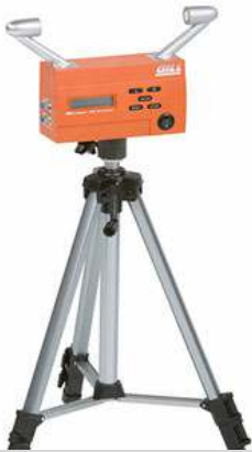
Im Paket enthalten: Ultraschall Windmesser

Diese Grossanzeige wird die Zuschauer Ihrer Leichtathletikveranstaltung begeistern!